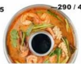
—290 / 430 Туристический Том Ям. Кисло-острый суп с креветками, миллиардом пряностей и кокосовым молоком. 350г / 700г. GF 🌶️🌿 ☺️ Таким его готовят туристам на Пхи-Пхи, Самуи и в Бангкоке.