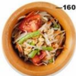
—160 Сом Там. Салат из зеленой папайи, томатов, чили, рыбного соуса, пальмового сахара и ферментированных креветок. 200г. GF 🌶️🌿