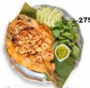
—275 Очень зажаренный сибас с очень зажаренным чесноком. 270г. GF 🌿