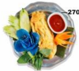
—270 Тайский омлет с мясом краба. 240г.