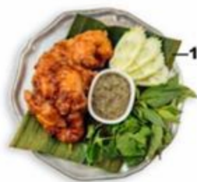
—155 Тайская жареная курица в сухарях. 300г.