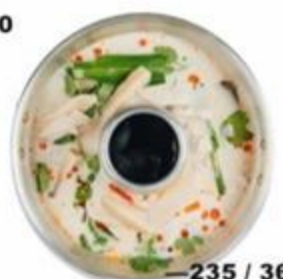
—235 / 360 Том Кха. Суп с кокосовым молоком, курицей, каффир лаймом, лимонграссом и галанганом. 350г / 700г. GF