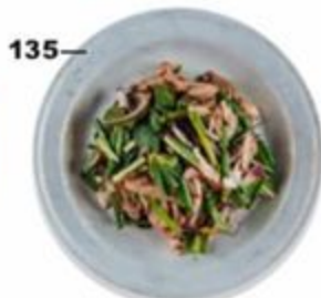
—135 Салат с курицей на гриле, рисовой пудрой, мятой, кинзой, тайской петрушкой и лаймом. 200г. GF 🌶️