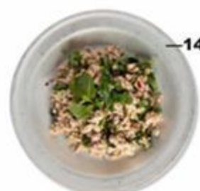
—145 Ларб. Фарш с каффир лаймом, рисовой пудрой, рыбным соусом и пальмовым сахаром. На выбор курица/тофу. 230г. GF VO 🌶️