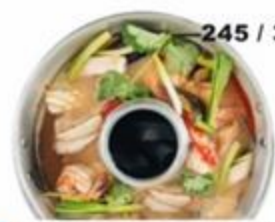
—245 / 365 Настоящий Том Ям. Кисло-острый суп с креветками, кальмарами, лимонграссом, галангалом, соком лайма и грибами. 350г / 700г. GF 🌶️🌿 ☺️ Очень кислый и очень острый. Таким тайцы его готовят дома.