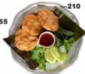
—210 Шримп Кейки. Котлеты с креветками, яйцом, сухарями, кунжутным маслом, кинзой и устричным соусом. 200г.