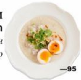
—95 Джок. Мелкодисперсный рис с имбирем, яйцом, кинзой и митболами. 360г.