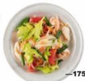
—175 Ям Вун Сен Талай. Теплый салат с креветками, томатами, сельдереем, луком, жареным арахисом и рисовой лапшой. 250г. GF 🌶️🌿